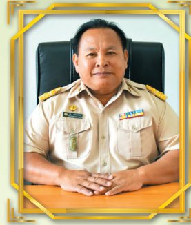
นายรุ่ง หมี่กระโทก รองประธานสภาฯ