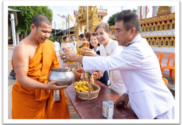
กิจกรรมวันพระราชทานธงชาติไทย